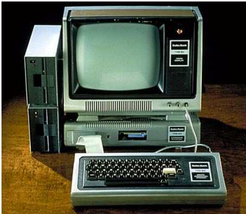
Bild 2. TRS-80, en av ABC 80's konkurrenter.