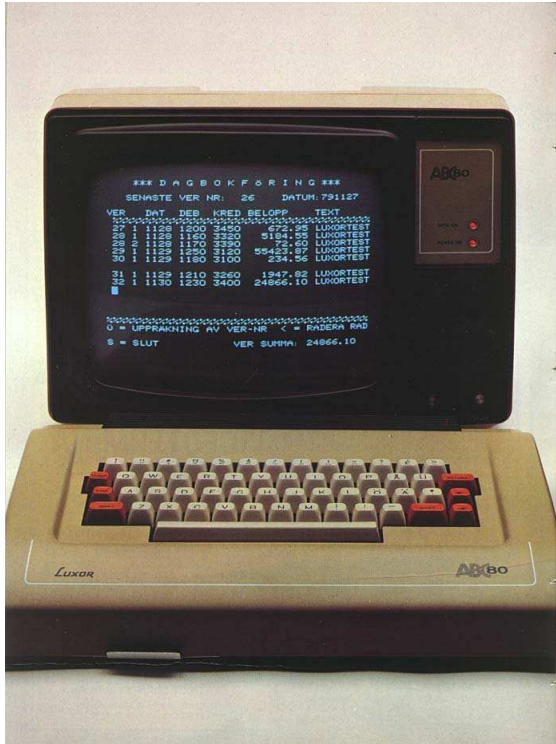
Bild 1. Annons som talar om ABC 80 som en inträdesbiljett till datortekniken. Till höger listas några av de återförsäljare som ingick i Luxors återförsäljarnätverk av datorer, Team 100.