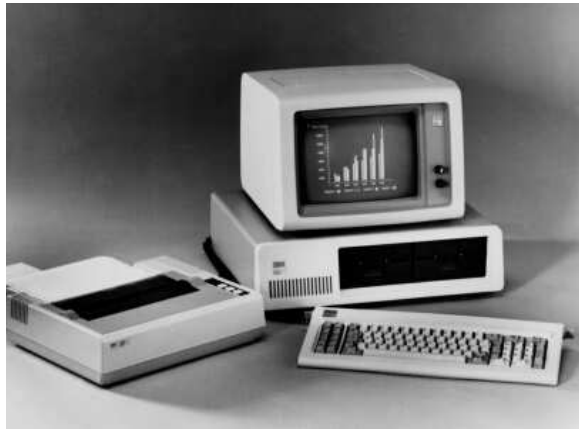
Bild 3. IBM Personal Computer, som kring mitten av 1980-talet kom att dominera marknaden.

Lite senare kom ABC 800. 6 I Mikrodatorn nummer 2 1981 skrev man: "Nu är den här, datorn som alla pratat om, men ingen har sett eller vetat så mycket om." Och det ser ut som om Luxor har lyckats att uppfylla dom förväntningar många hade på den nya datorn. Den kan fås med 40 eller 80 teckens skärm, den har färg och högupplösningsgrafik, 2 kilo ords BASIC är standard och många hjälprutiner finns, och den har en snygg design. Det är alltså ett stort steg framåt, men man ser ändå släktskapen.